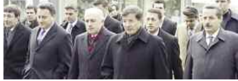
Başbakan Ahmet Davutoğlu, geçen haftalarda Sinanpaşa Cami'nde namaz kıldı. Yürüyerek Dolmabahçe'den Beşiktaş merkeze meydana indi ve vatandaşlarla da sohbet etti.

B aşbakan Ahmet Davutoğlu tarafından açıklanan başlangıç olarak 14 Ocak 2015 tarihi belirlenen vergilendirme ile değer artışıyla elde edilen gelir konusu gündem oluşturdu. Buna göre en az yüzde 50'si kamuya geçecek. Projelerde emsal artışının tüketiciye yansıtacağı düşünülüyor. Buna göre fiyatlara yüzde 10 ile 25 arasında yansıtılabilir. Uzmanlar değer artışı mevcut imar planları üzerinden yapılsa Boğaz, Maslak,