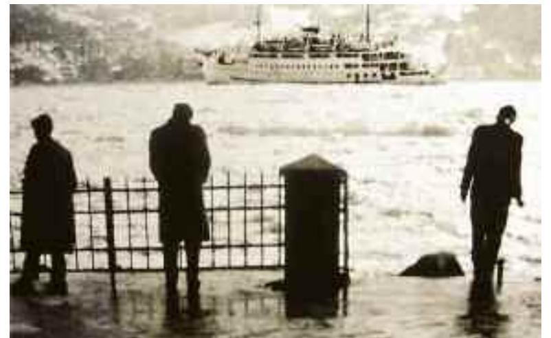
Bir zamanlar: 1954'te Tuna Nehri'nden gelen buz parçalarıyla kaplanan Boğaz.