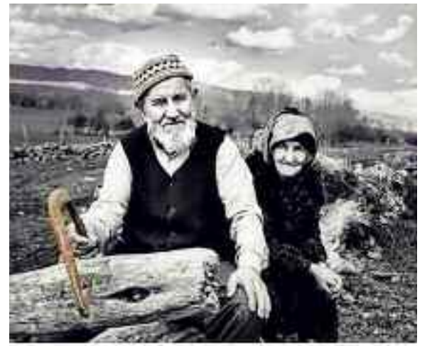
BEŞİKTAŞ MEDYA GRUP "Güzel elbiseler alamadım sana hep aynı entari" dedi adam, "Haram lokma geçirmedin boğazımdan yetmez mi" dedi kadın...